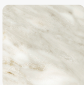
Venato K023 SU Struktura površine Super mat