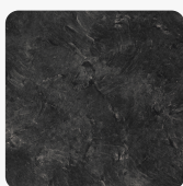
Škriljac 3953 PE Struktura površine Perl